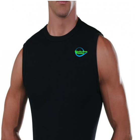
BioActive Top Tank

Débardeur homme/femme en tissu BioCeramic. Il contribue à soulager la sensation de fatigue, à améliorer le tonus musculaire et à procurer un bien-être général à l'ensemble du corps.